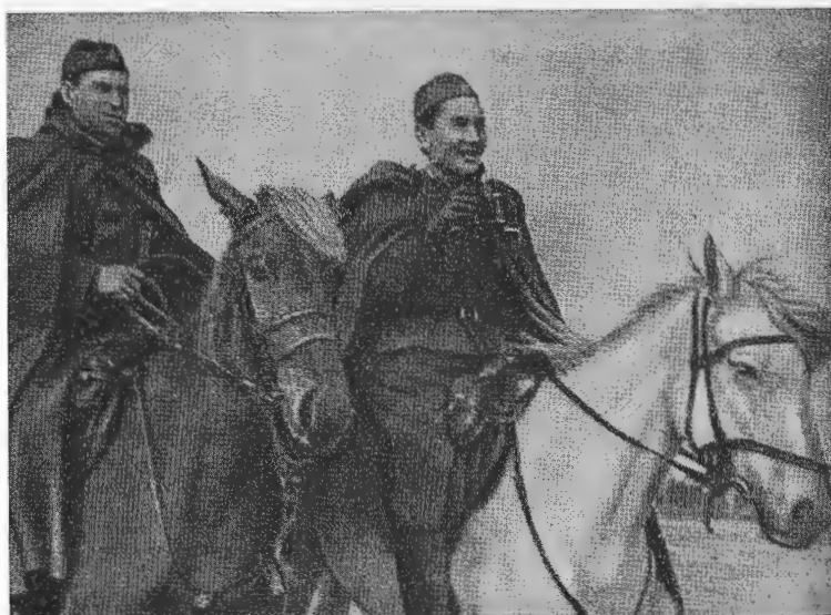
Б. Момыш-улы (справа), 1942 г.