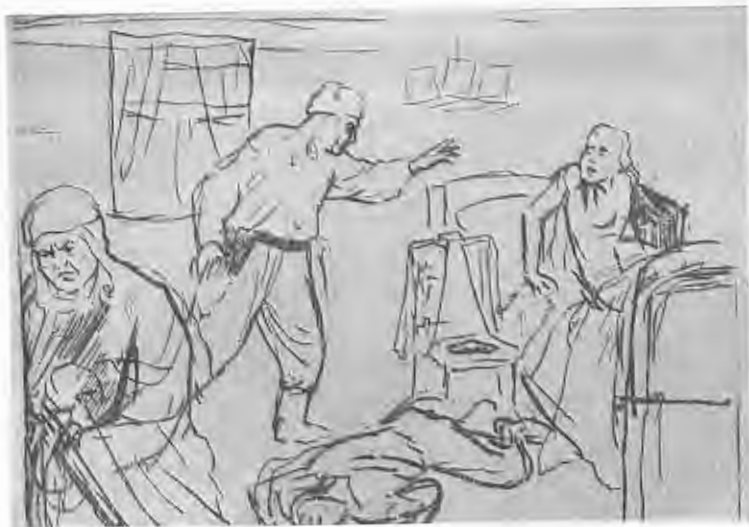
Иллюстрация автора к рассказу «История одной ночи»