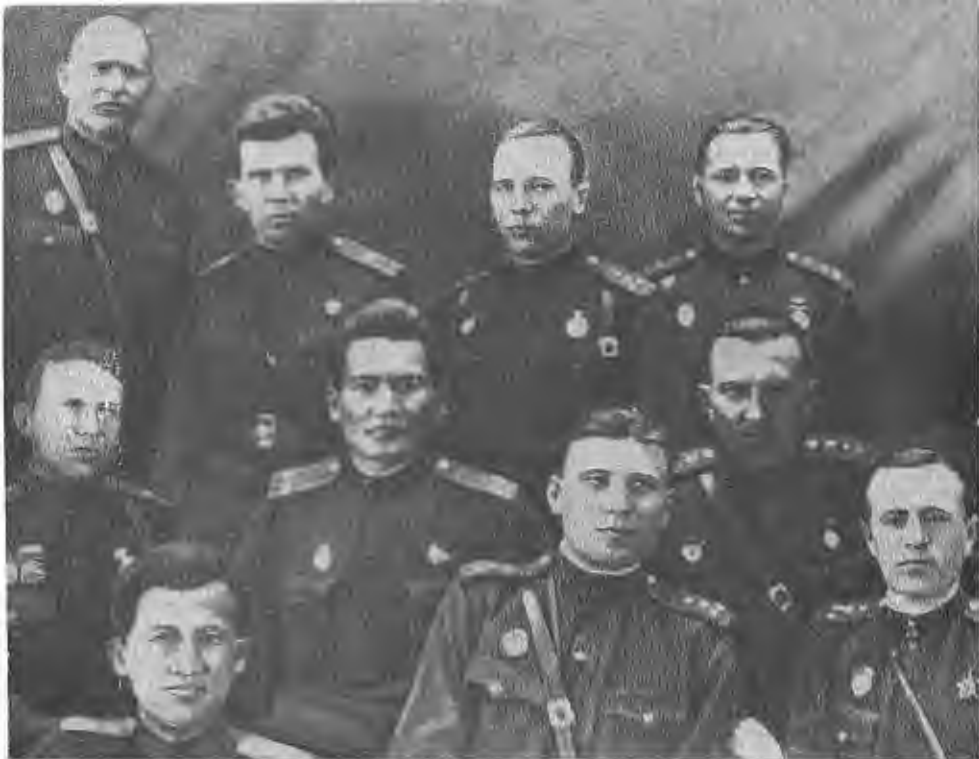
Момыш-улы (в центре) среди однополчан.