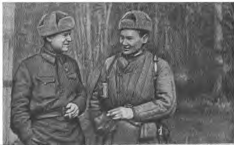
Б. Момыш-улы (справа), 1942 г., март