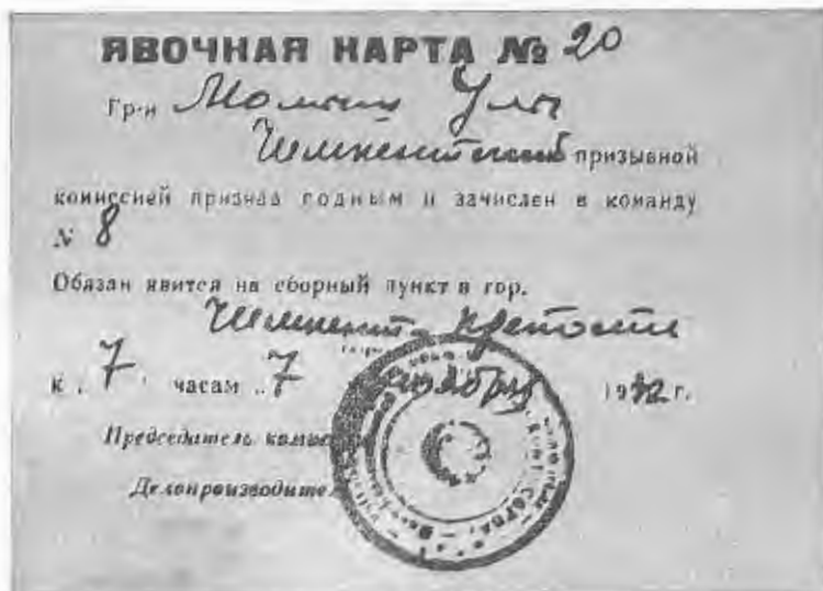
Явочная карточка. 1932 г.