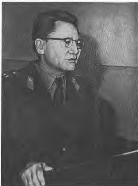
Во время встречи с читателями, 1959 г.

Полковник Логвиненко вручает Момыш-улы символический ключ от Москвы, сентябрь 1971 г.