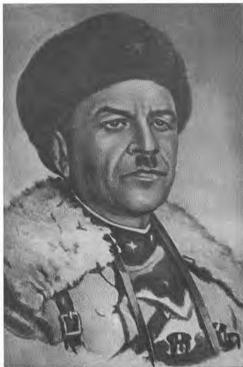
И. В. Панфилов, ноябрь 1941 г.